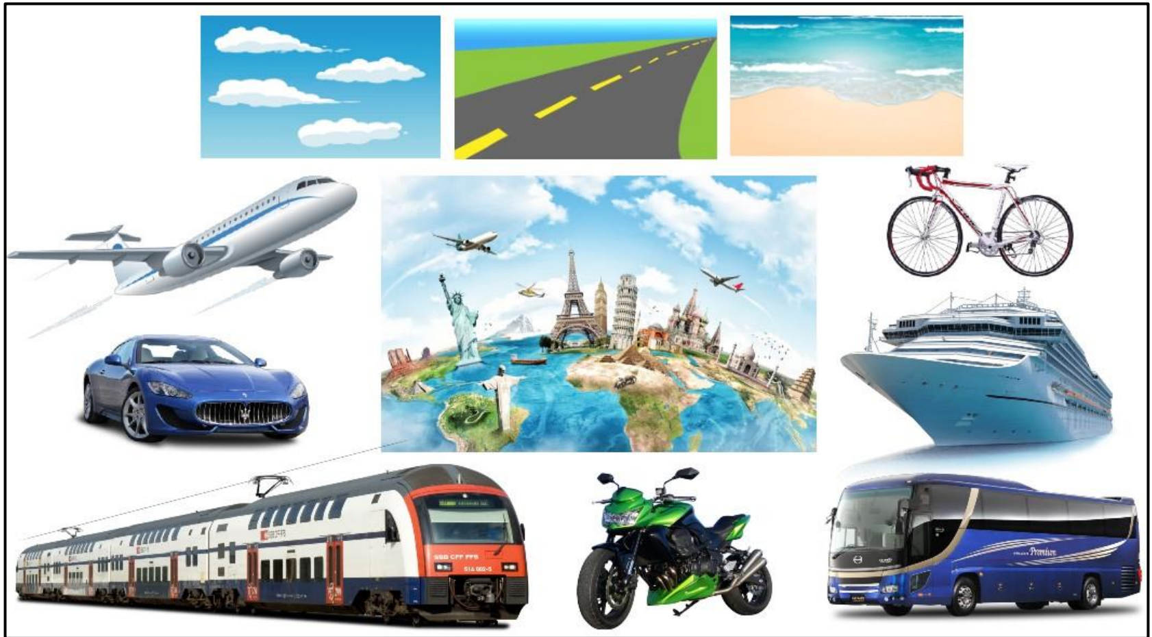
Набор карточек «Виды транспорта»