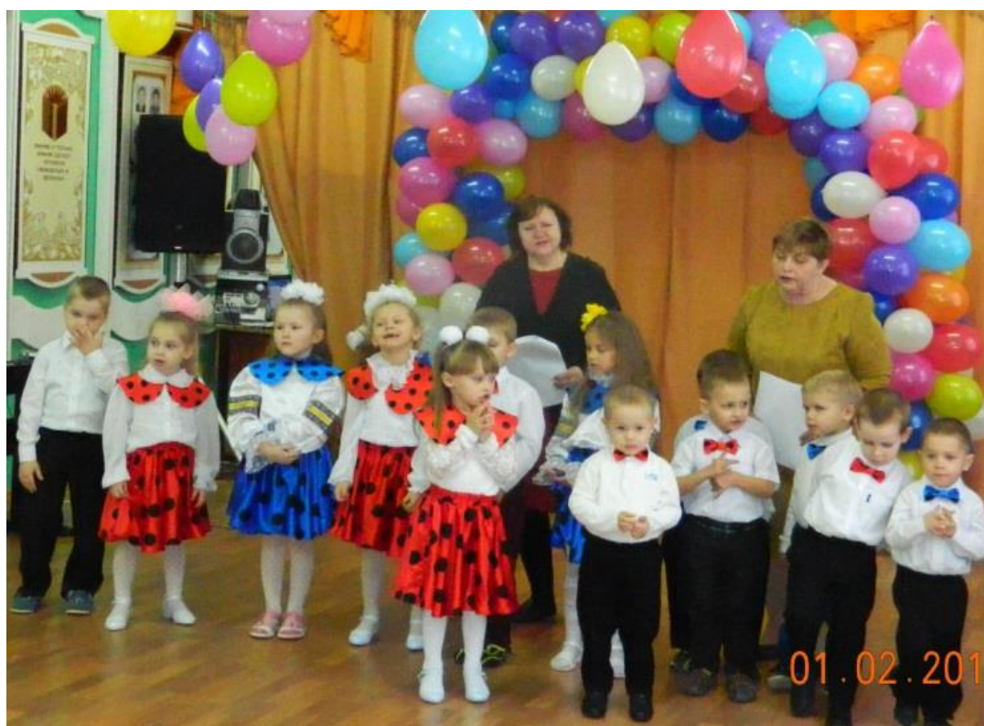
Все таланты на сцене!