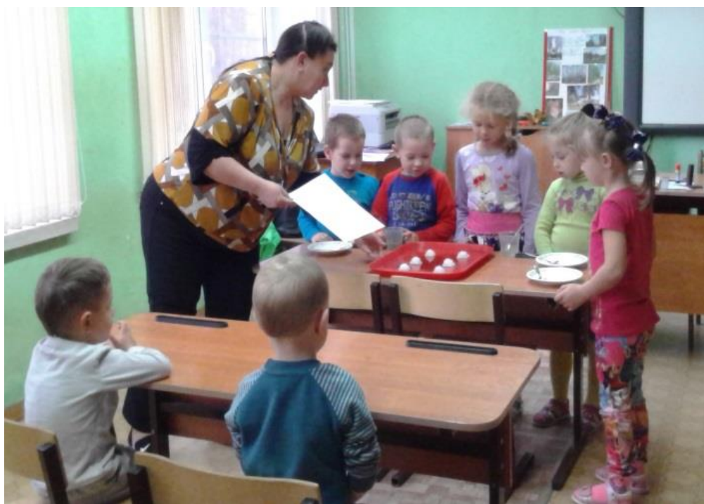
Группа дошкольного учреждения «Ладушки» проводит свои первые опыты