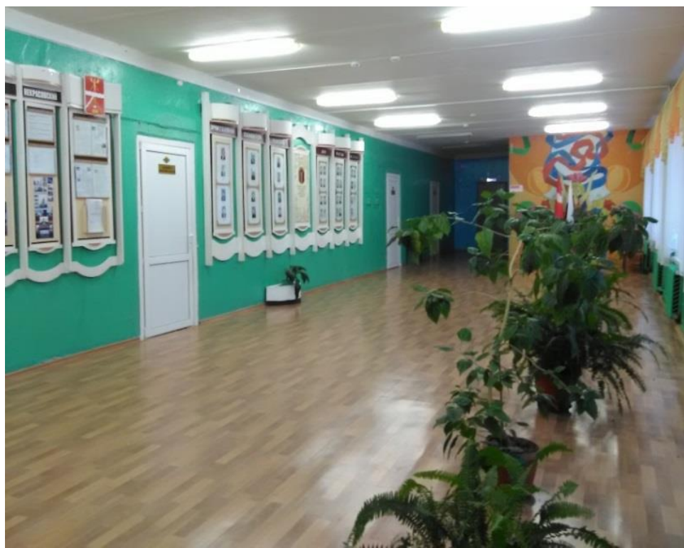
Уютный коридор малокомплектной школы