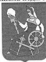
Рис. 2. Герб города Иваново

На все иллюстрации в тексте должны быть даны ссылки.