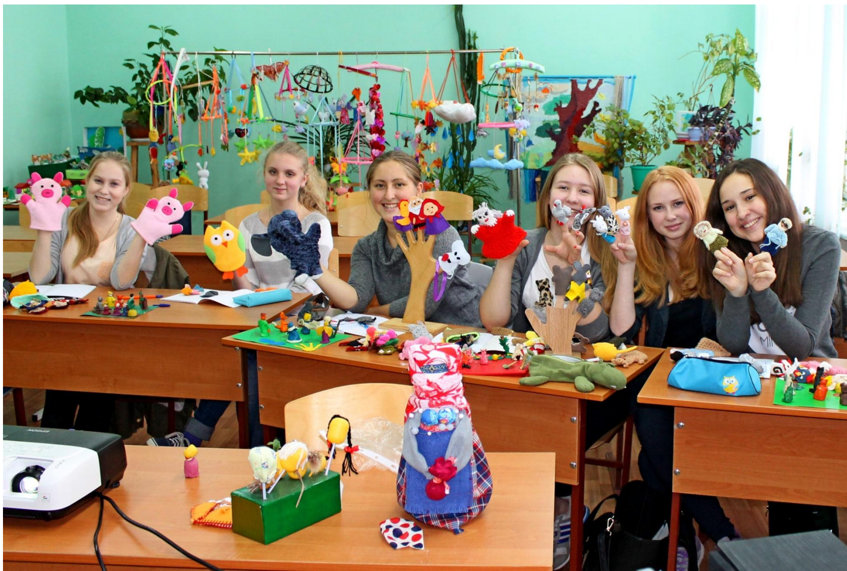
Овладение технологиями различных кукольных театров