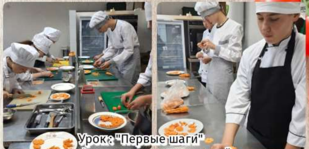
Урок: "Первые шаги" форма нарезания овощей (простая, сложная)